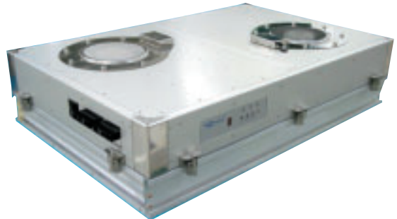
ネオストリーム クラシック