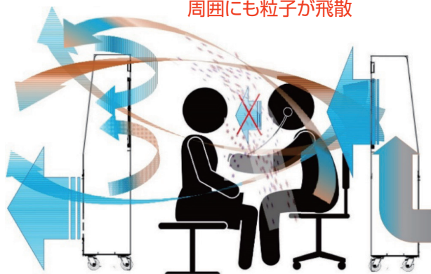
粒子を拡散させる誤った使い方