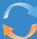
気流可視化確認試験