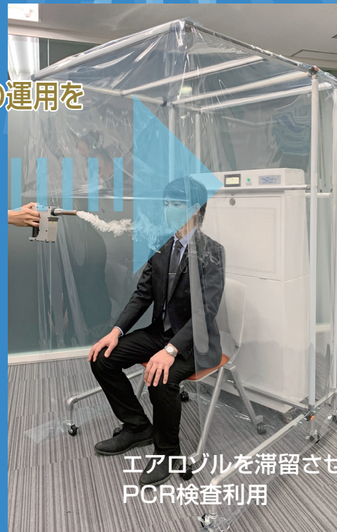
エアロゾルを滞留させない PCR検査利用