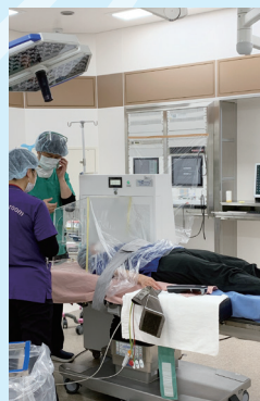
手術部、麻酔科 陰圧BOX化例