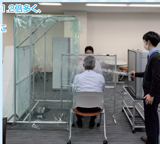
正しいサイドフローの使い方