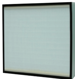
溶菌酵素固定化 HEPAフィルタ

JIS L 1922 抗ウイルス性試験でA型インフルエンザウイルスにてウイルスの不活化を確認した酵素を使用。