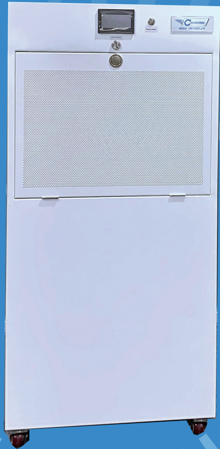
HEPA内蔵パーテーション型空気清浄装置