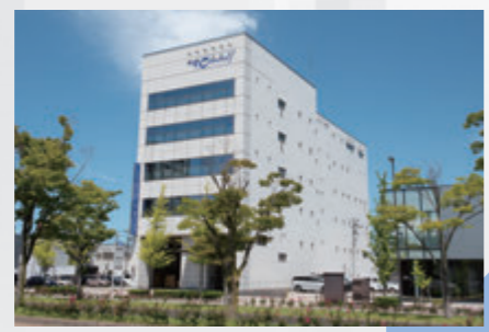
北陸営業所 金沢ショールーム 金沢流通センター